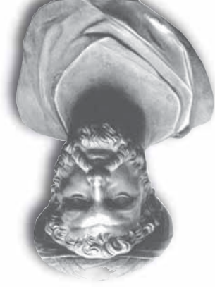
Busto di Pitagora, II d.C. Roma, Musei Capitolini.