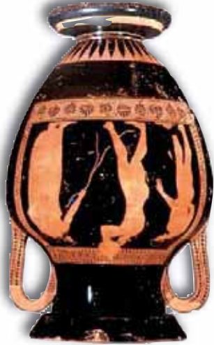
Immagine del pentatleta crotoniate Phayllos