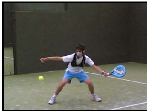
Imagen 2: Determinación de las demandas fisiológicas en juego real.

La recogida de gases espirados durante la prueba de tapiz rodante y el juego real (Imagen 2) se efectuó con el analizador portátil MetaMax 3B (CORTEZ Biophysik GMBH, Germany), con tecnología “breath by breath”. Los datos, recogidos a través de telemetría en un PC receptor, fueron analizados por el software Metasoft 3. Este sistema telemétrico permitió, además, obtener, con una frecuencia de 2-3 s, el registro de la frecuencia cardíaca (FC) durante toda esta prueba, pudiendo definir así la FC máxima ( FC_{max} ) y establecer relaciones entre FC y varios de los parámetros respiratorios, como el VO_{2max} y VT2.