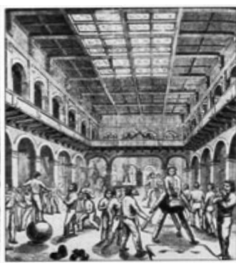
Ejercicios y aparatos dentro de una Sokolovna, 1863