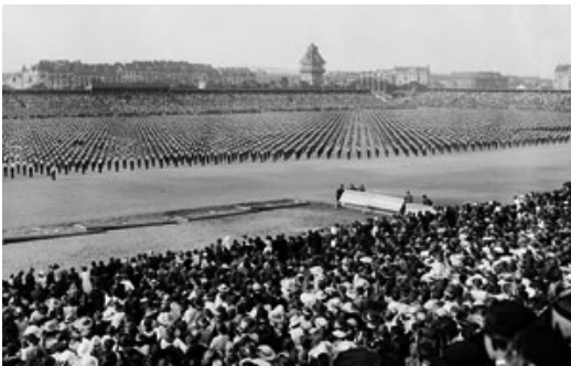
Slet de 1920 (Praga)

El entrenamiento estaba estructurado en torno a cuatro tipos de ejercicios: a) ejercicios físicos que no necesitan ayuda de nadie ni de ningún aparato, b) aparatos de gimnasia, c) ejercicios donde hacía falta la ayuda de una persona, y d) ejercicios de lucha (Macháček, 1938). Esta división no era original, reflejaba la influencia del Turnverein alemán, sin embargo Tyrš aportó una mayor variedad de ejercicios sobre cada uno de los aparatos, con el objetivo de hacer trabajar todos los músculos del cuerpo y generar cuerpos atléticos más equilibrados.